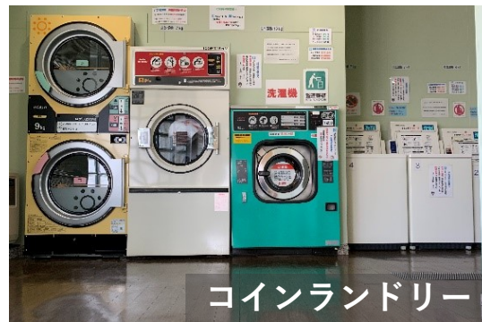
コインランドリー